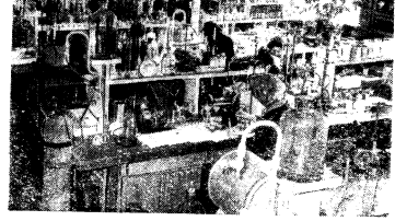
Лаборатория кафедры ТНВ.