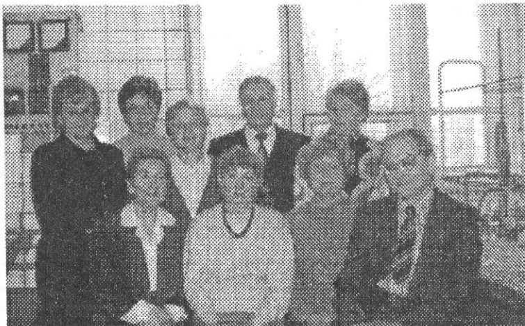
Лучшие лекторы кафедры