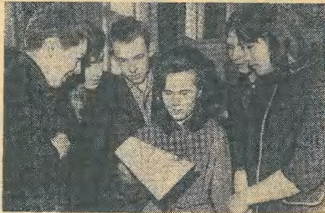
Наши комсомольцы проводят большую работу в подшефных школах. Не так давно они приняли активное участие в подготовке и проведении химической олимпиады школьников. На снимке: победители химической олимпиады подшефных школ.

После окончания нашего химико-технологического института многие студенты будут работать начальниками смены, мастерами. Для этого необходимо быть не только хорошим специалистом, но и воспитателем, пропагандистом идей марксизма-ленинизма.