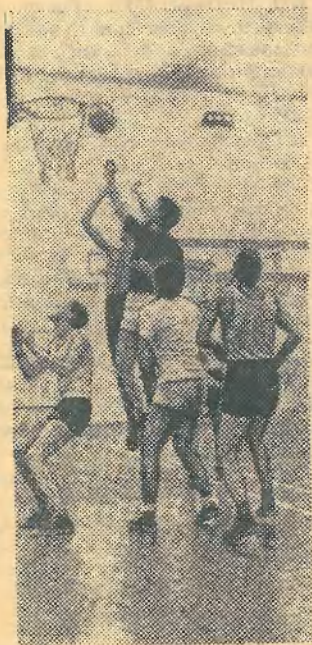
В физкультурном зале.