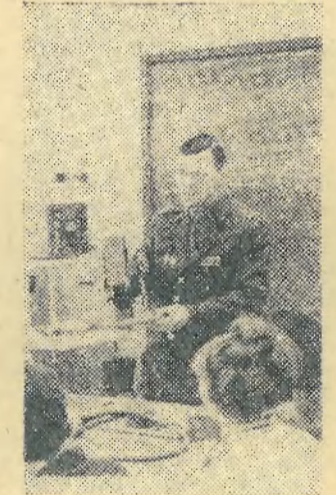
На снимке: занятия по военной подготовке.