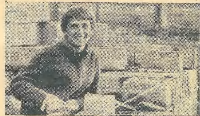
Настроение всегда отличное

Вот и вернулись студенческие строительные отряды в родную Менделеевку. Привезли с собой массу впечатлений, адресов новых друзей, дневники и альбомы, готовые фотографии и еще непроявленные фотопленки.