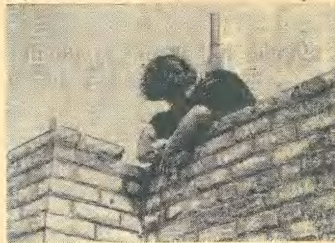
Уложен тысячный кирпич