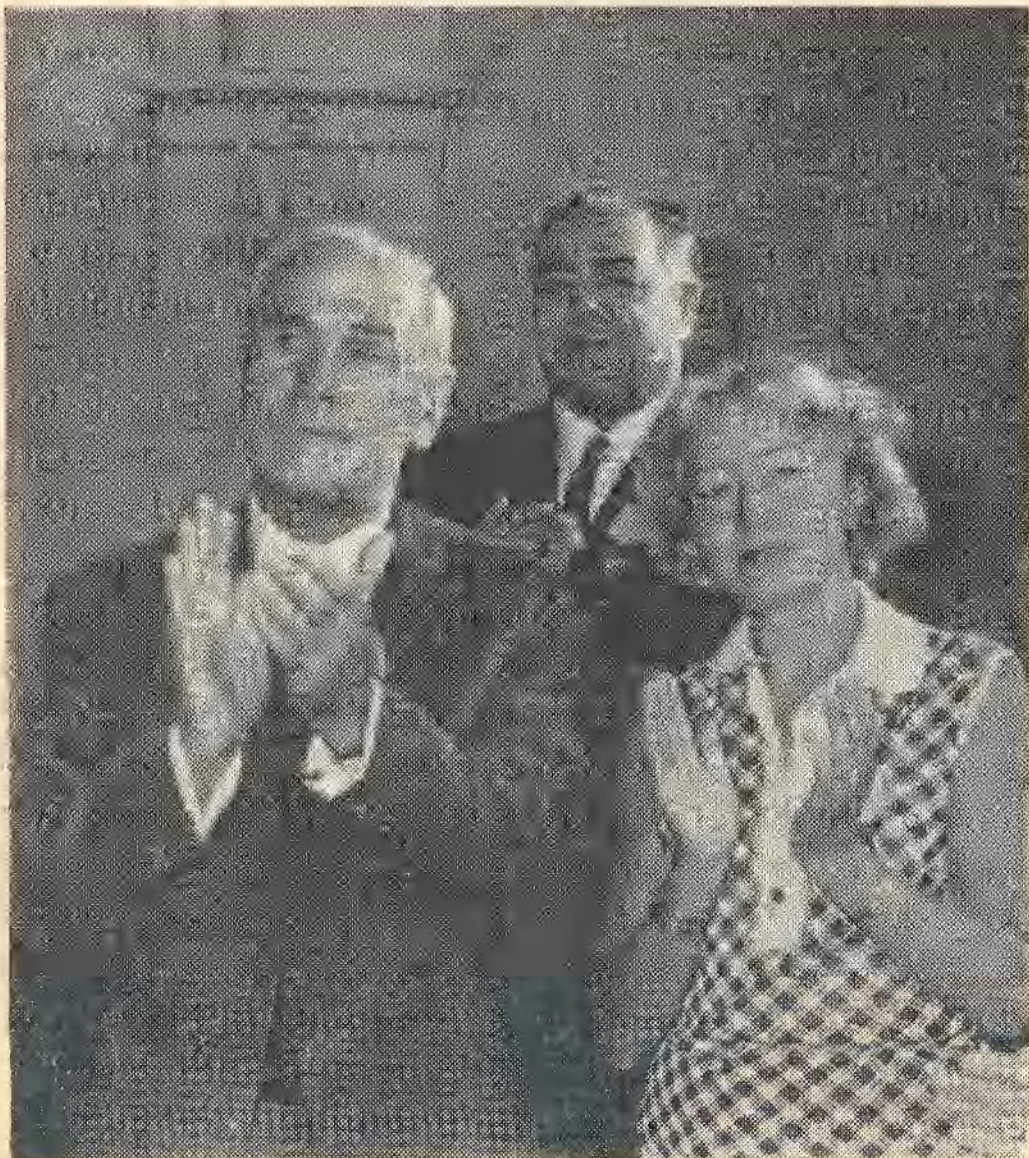
На снимке (слева направо): народный артист СССР Б. А. БАБОЧКИН, народная артистка СССР Г. С. УЛАНОВА, ректор Химико-технологического института имени