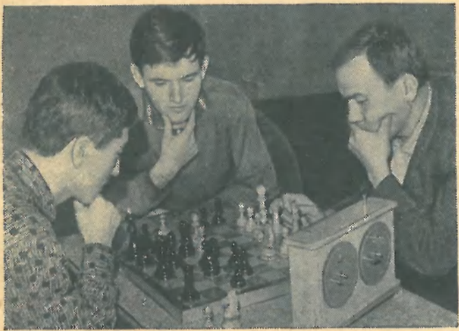
Пообедав, можно дать пищу и мозгам. Так решили эти студенты, уютно устроившись за шахматным столиком в вестибюле общежития.